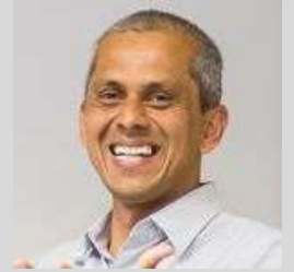
教授 Saji Hameed