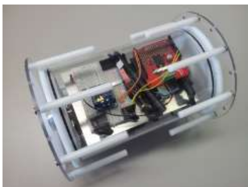
図1:ロッド型車輪機構による軟弱地盤移動用ロボット。