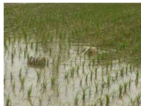
図3:水田での走行実験の様子。