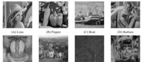
再現されたカバー画像の画質(PSNR in dB)