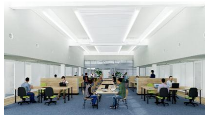
新UBICインキュベーションスペース (イメージ図)

※プロジェクトルーム使用者は、その他オープンスペース（インキュベーションスペース、カフェスペース、多目的ルーム）が使用できます。