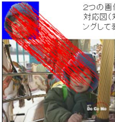
2つの画像間でのピクセル対応図(対応点はサンプリングして表示)