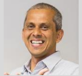
教授 Saji Hameed