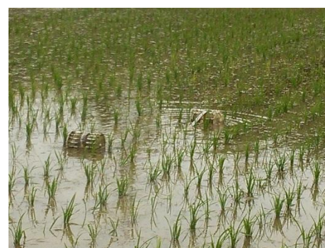
図3:水田での走行実験の様子。