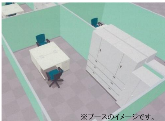
※ブースのイメージです。