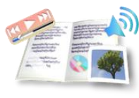
ドキュメンティング