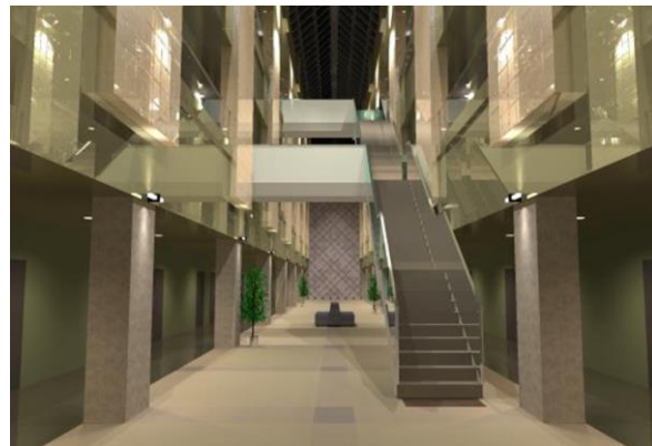
光線追跡による生成画像

従来技術では、動的なシーン（物体の移動、追加、削除を含むシーン）を描画するために、フレームごとにBVH木を作り直すか、或いは劣化を伴う木の更新を行う必要があった。本技術を用いれば、木を劣化させることなく高速に更新を行うことができ、総描画コストの削減が可能である。